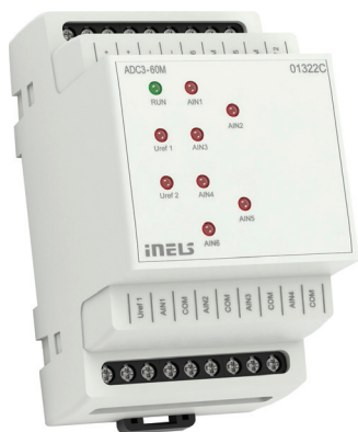
Artikal ADC3-60M: 8595188133012